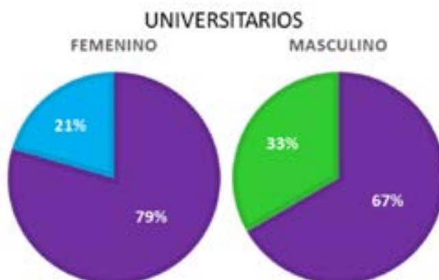
Figura 1. Porcentaje de alumnos masculinos y femeninos agrupados por rango de edad; violeta: 18 a 30 años; celeste: 31 a 48 años; verde: 31 a 44 años.

Dentro del grupo de estudiantes de la UNLP, el 25% ejerce la actividad docente y el 54% lo hace en el nivel secundario de gestión pública, el 15% en secundarios de gestión privada, el 39% en plan FinEs (Programa para terminar los estudios) y el 2% en el nivel terciario de educación (gestión pública) y en forma particular. En relación a los estudiantes de ISFD el 41% trabaja como docente, ejerciendo en su mayoría (45%) en el nivel secundario de gestión pública, el 22% en colegios secundarios de gestión privada, el 22% de manera particular y un 11% en el nivel terciario de gestión pública.